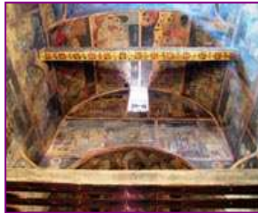
Links: Ohrid Rechts: Sv. Naum

Dag 11, 13.09. Dag gereserveerd voor bezoek aan twee gotkerkjes van Kalista en Radozda, die net buiten de stad liggen. Hier trokken ooit monniken zich terug om in ascese te leven en zich over te geven aan het geloof. De rest van de middag eventuele bezichtigingen in Ohrid, waar we de vorige dag niet aan toegekomen zijn. Georganiseerd diner in restaurant in Ohrid ter afsluiting van de reis (in de prijs inbegrepen). Overnachting in Ohrid.